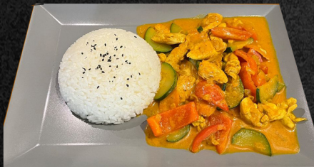
Curry Reis mit Huhn